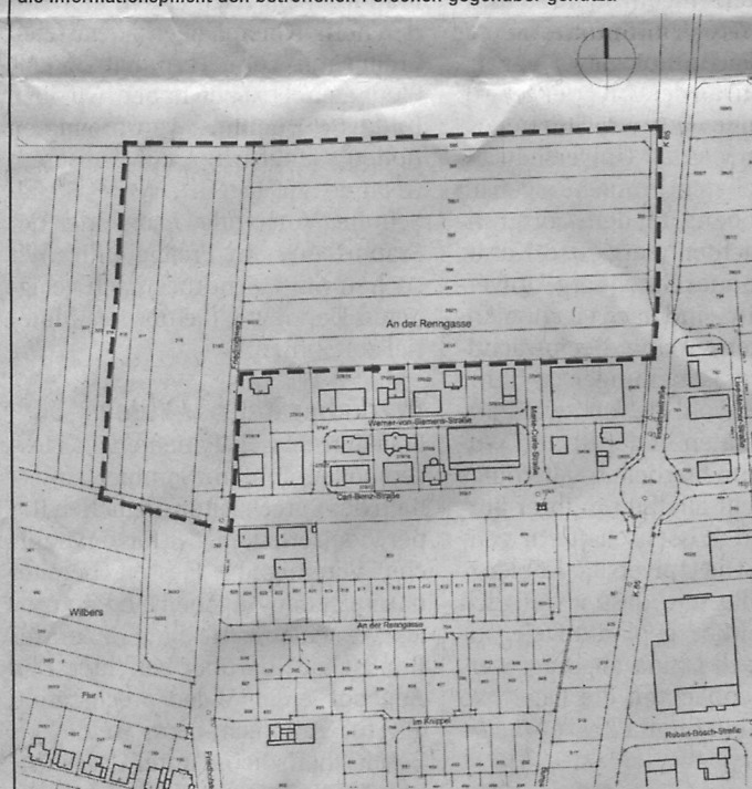
Geltungsbereich des Bebauungsplanes Nr. 38 „Gewerbegebiet Nord II“ in Einhausen (unmaßstäblich)

Es wird darauf hingewiesen, dass Dritte (Privatpersonen) mit der Abgabe einer Stellungnahme der Verarbeitung ihrer angegebenen Daten, wie z.B. Name, Anschrift, Telefonnummer, E-Mail-Adresse etc. zustimmen. Gemäß Artikel 6 Abs. 1c und Abs. 1e der Datenschutz-Grundverordnung (DSGVO) werden die Daten im Rahmen des Bauleitplanverfahrens für die gesetzlich bestimmten Dokumentationspflichten und für die Informationspflicht den betroffenen Personen gegenüber genutzt.